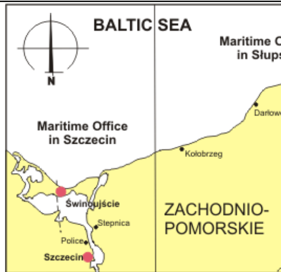
Mapa 1. Usytuowanie Portu w Szczecinie. Źródło: Urząd Morski w Szczecinie

Port Szczecin jest usytuowany na Odrze i jej prawym ramieniu Regalicy. Położony jest w zachodniej części Pobrzeża Szczecińskiego, w północnej części Doliny Dolnej Odry na Międzyodrzu [27-29]. W skład portu wchodzi akweny będące odgałęzieniami Odry i kanałami: Przekop Mieleński, Kanał Grabowski, Duńczyca, Kanał Wrocławski, Parnica, Kanał Dębicki oraz jezioro Dąbie [27-29]. Na rysunku nr 1, przedstawiona została mapa kanałów i basenów Portu w Szczecinie.