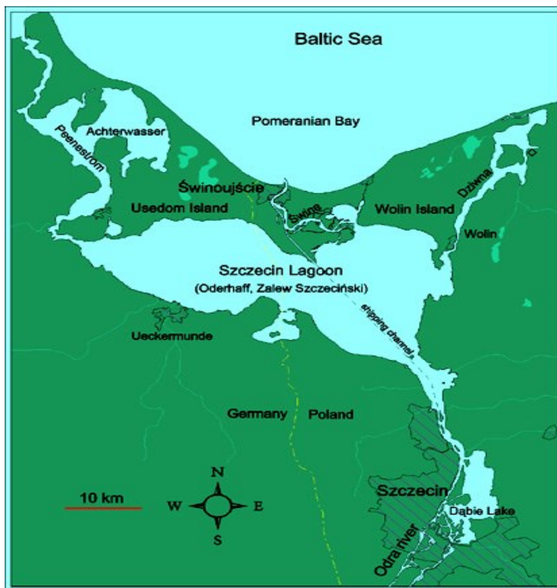
Mapa 1. Usytuowanie Portu w Świnoujściu.

Na mapie nr 1, przedstawiono usytuowanie Portu w Świnoujściu.