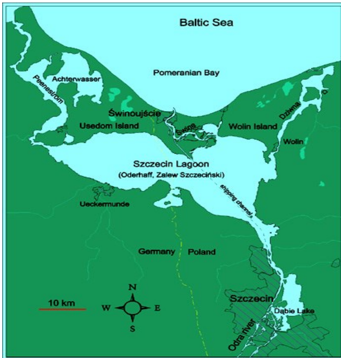
Mapa 1. Usytuowanie Portu w Świnoujściu.

Na mapie nr 1, przedstawiono usytuowanie Portu w Świnoujściu.